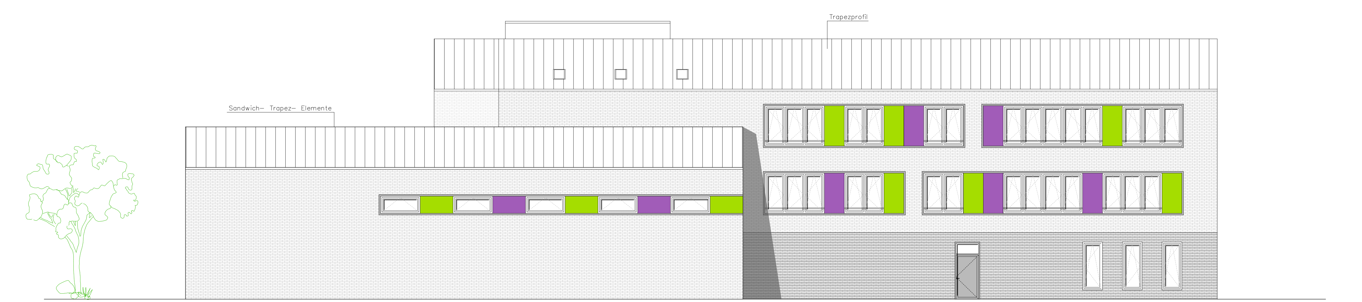
ANSICHT NORD- OST