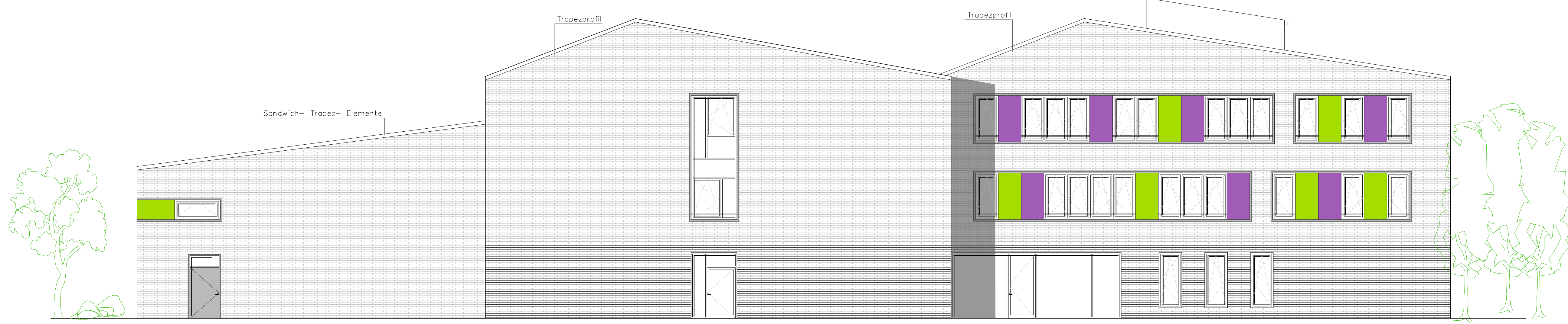
ANSICHT NORD- WEST